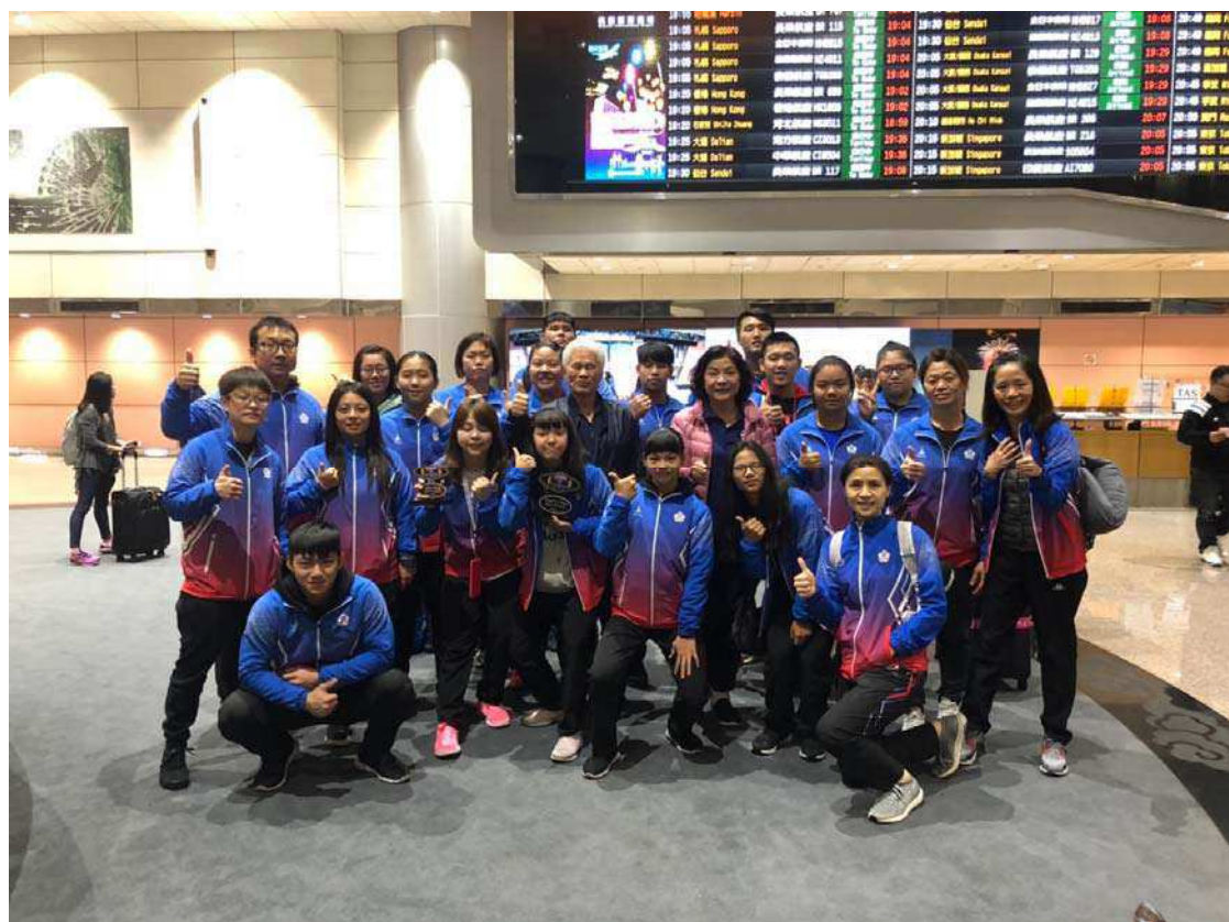
世青少代表隊與張會長與張理事長合影