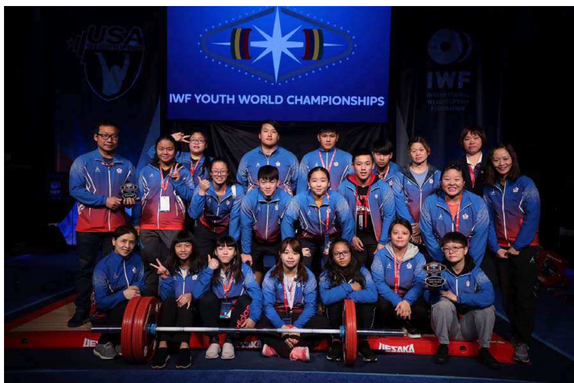
世青少代表隊閉幕團體照